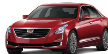
Red Horizon Tintcoat