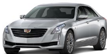
Radiant Silver metallizzato