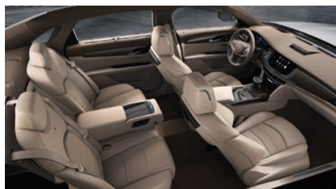
Sedili in pelle semianilina Very Light Cashmere con dettagli cruscotto Maple Sugar e inserti forati Chevron, e con finitura in legno di eucalipto Cafe Noir extralucido/in legno di eucalipto Cafe au Lait extralucido