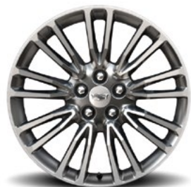
Cerchi da 20" x 8,5" a 5 razze verniciati premium Manoogian Silver con 5 inserti cromati