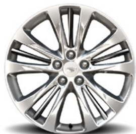
Cerchi da 20" x 8,5" con finitura a macchina extra lucida, multirazze con inserti Manoogian Silver