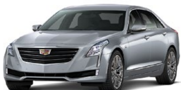
Satin Steel metallizzato