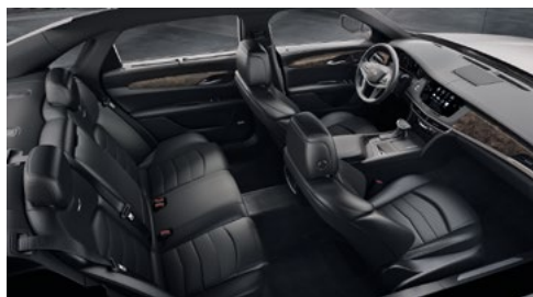
Superfici dei sedili in pelle Jet Black con inserti forati, dettagli cruscotto Jet Black e finiture in legno di pioppo nodato Mineral extralucido/finiture in fibra di carbonio color bronzo extralucido