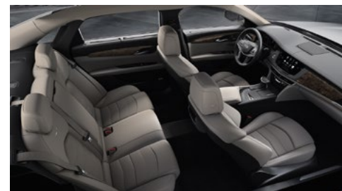
Superfici dei sedili in pelle Light Platinum con inserti forati Chevron, dettagli cruscotto Jet Black e finiture in legno di pioppo nodato Mineral extralucido/finiture in fibra di carbonio color bronzo extralucido