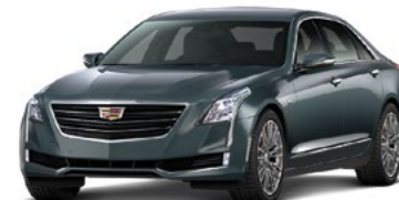
Stone Gray metallizzato