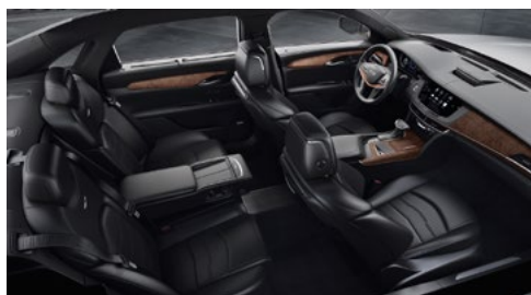
Superfici dei sedili in pelle semianilina Jet Black con inserti forati Chevron e finiture in legno di sapele Choco Noir extralucido/in fibra di carbonio color bronzo extralucido