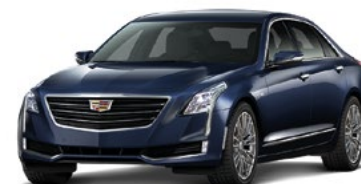
Dark Adriatic Blue metallizzato