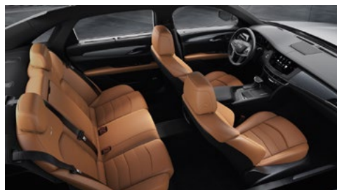
Superfici dei sedili in pelle Cinnamon con inserti forati Chevron, dettagli cruscotto Jet Black e finiture in fibra di carbonio extralucido con trama effetto diagonale/finiture Piano Black