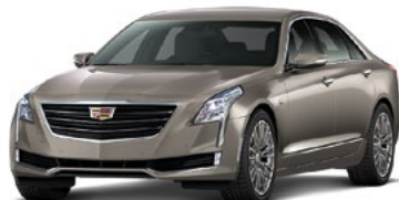
Bronze Dune metallizzato