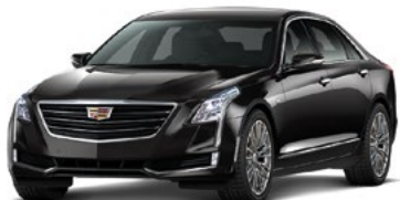
Stellar Black metallizzato