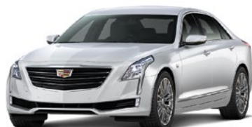
Crystal White Tricoat